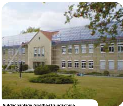
Aufdachanlage Goethe-Grundschule Zossen // D-Brandenburg