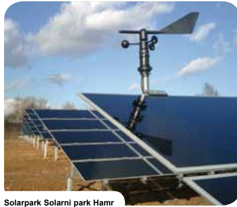
Solarpark Solarni park Hamr Hamr na Jazere // CZ