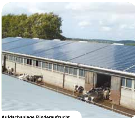
Aufdachanlage Rinderaufzucht Kohren Sahlis // D-Sachsen