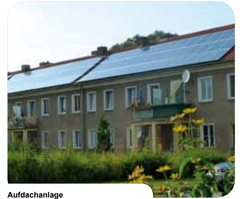
Aufdachanlage Zossen // D-Brandenburg