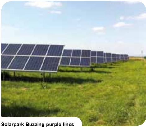
Solarpark Buzzing purple lines Čehovice // CZ